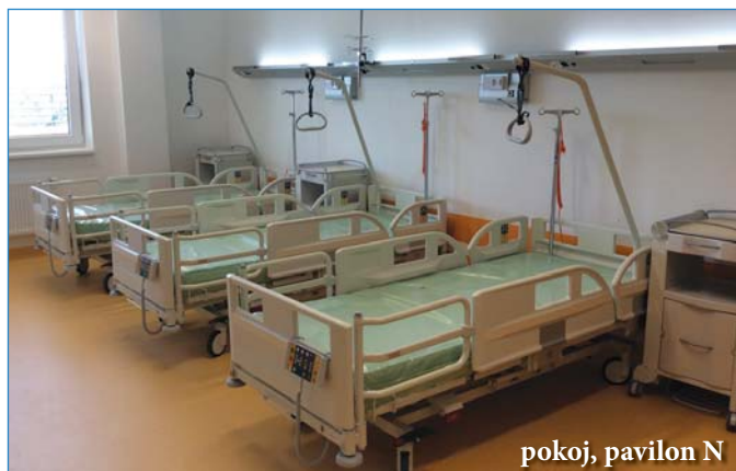
pokoj, pavilon N

Interní oddělení provozuje celkem 83 lůžek standardní